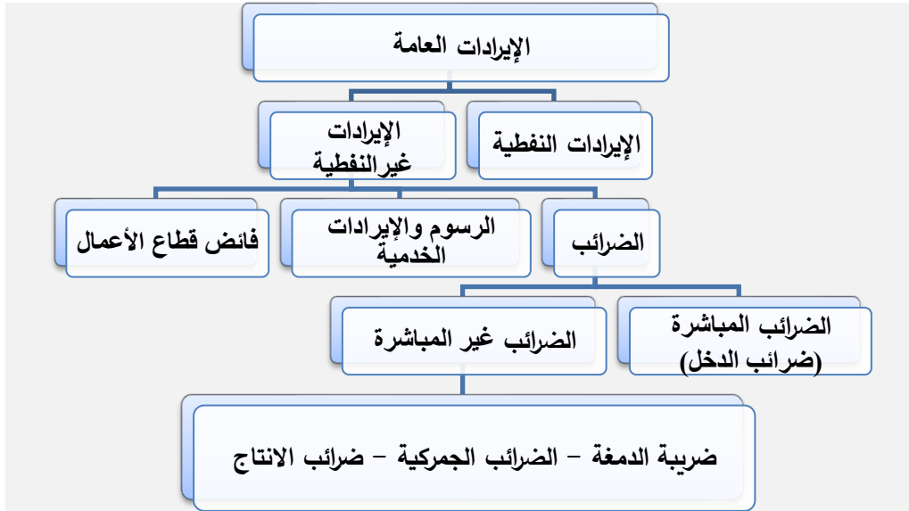
شكل رقم (1) هيكل الإيرادات العامة للموازنة العامة الليبية.