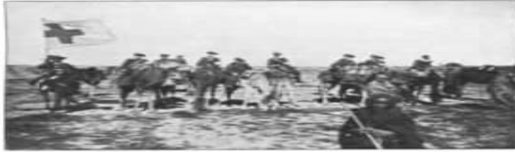
Abb. 2b. Die Pfleger auf dem Marsche.

erwähnt habe, daß die während des Marsches nötigen Utensilien, unsere Koffer, Zelte, die Verpflegungskisten etc. zuerst auf die Kamele geladen und möglichst rasch transportiert wurden, war es unmöglich, alle Sachen sofort und rasch zur Stelle zu haben, da die Araber an eine irgendwie regelmäßige Marschleistung nicht zu gewöhnen waren, und die Kamele sich stets nach den einzelnen Tribus gruppierten, so daß, wenn auch darauf gedrungen wurde, die nötigen Sachen zusammenzuhalten und möglichst rasch zu transportieren, stets am Abend bei Beendigung des Marsches Unordnung eingetreten war, und die nötigsten Sachen oft mit den allerletzten Kamelen am Lagerplatz anlangten. Trotz allen Bemühungen ließ