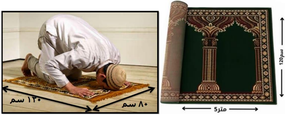
(شكل 7) يحتاج الفرد في حيز الصلاة الى أبعاد محددة سواء أثناء الجلوس بالمصلي المنزلي أو أثناء أداء فريضة الصلاة.

ويشغل المصلي الفرد حيزاً مستطيلاً يصل طول ضلعة الأصغر الى حوالي 80 سم بينما طول ضلعه الأكبر حوالي 120 سم (11). ومن هنا تم اعتماد مقياس الفراغ للمصلي في حالة الصلاة الفردي ، وتتضاعف كلما زاد العدد ، ولقد تم تصميم سجاد خاص بهذه الأطوال يمكن استخدامها في المصلي المنزلي (شكل 7). ويجب أن يتميز سجاد المصلي المنزلي بجودة عالية ومتانة لتحمل الاستخدام الكثيف، ويفضل صناعته من الأكريليك لنعومتها وثبات لونها ولا ينبعث منها أي روائح ، أو خامة البولي بروبيلين لكثافته ونعومته وتحمله للاستخدام الكثيف علي مدار اليوم ، ويفضل ان تكون الوبرة بارتفاع 10-14 ملم لراحة الركب والمفاصل أثناء السجود ، كذلك ان يتميز بوزن ثقيل ليثبت على الأرض ولا يتحرك أثناء الصلاة ، ومقاومة للبكتيريا لاستعمال الماء في الوضوء باستمرار .