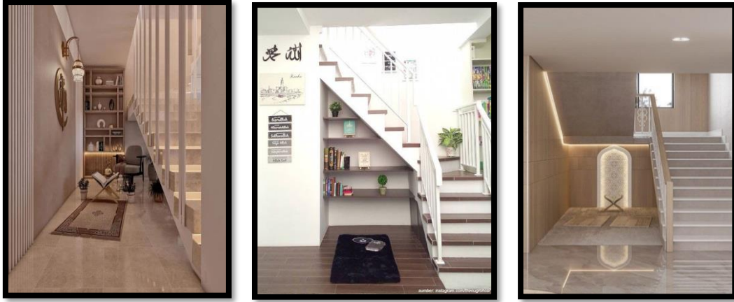
(شكل 2) في حالة المساحات المحدودة يمكن استغلال المساحة المهملة تحت السلم كمكان مستقل للمصلي منزلي .