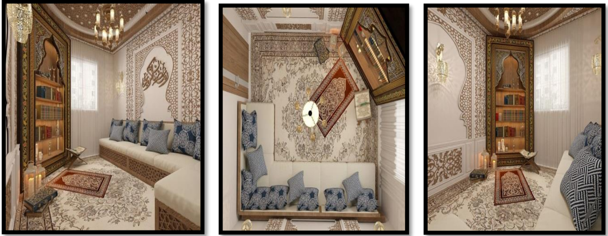
(شكل 3) لايزال المحراب يصمم علي غرار الاصل ، علي شكل عمودين يعلوهما عقداً ويكون الشكل غائر ويستفيد من الفرق في المستوي الحائط والمحراب بالإضاءة المخفية لتأكيد علي جدار القبلة .

وكان المحراب من حيث الشكل في بعض الأحيان يكتتفه عمودان من الرخام يحملان عقداً، ويسقف أعلاه بنصف قبة تعرف بطاقيه المحراب كانت تزين بالمقرنصات، وقد يكسى المحراب، بالجص المزخرف بالحفر البارز والغائر، أو بالرخام والمرمر، أو ببلاطات القاشاني، أو بالفسيساء الرخامية أو الخزفية أو الزجاجية المشكلة بالحليات الهندسية والنباتية المحورة، وكان يكرم بالآيات القرآنية المناسبة لوظيفته (10)(شكل 3) .