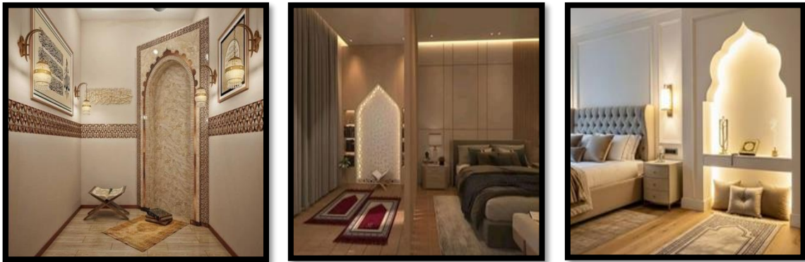
(شكل 9) توضيح الإضاءة المركزة علي أهم عنصر في الفراغ وهو المحراب مع تناقض بين السطوح الكبير علي العنصر والظلال المحيطة به والإضاءة الخافتة مما يمنح العنصر أكثر أهمية وجمالاً ، والانارة الجانبية التي تعتبر وظيفية للقراءة .

وفي حالة محدودة مساحة المصلي المنزلي وضيق المكان ، يمكن تطبيق الاعتبارات التصميمية لجانب الإضاءة ، فالتصميم الجيد للمساحات الصغيرة يعني الفكر الجيد والتصميم الذكي الذي يسيطر علي حجم ومساحة الحيز لتأديه مجموعة من الوظائف والانشطة بأقل جهد وتكلفة وأفضل أداء وفي وقت زمني قصير من خلال حلول تصميمية متعددة لتعطي إحساس باتساع المساحة المتاحة من خلال المرونة والقدرة علي التغيير علي النحو التالي: